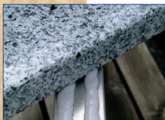
OTTOCOLL® M500 für elastische Klebungen unterschiedlichster Materialien im Außenbereich.