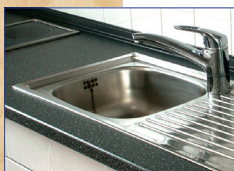
OTTOCOLL® M500 zum Kleben und Dichten von wasserbelasteten Fugen im Innenbereich.

OTTOCOLL® M500 verursacht keine Verfettung und ist somit für Marmor und Naturstein geeignet .